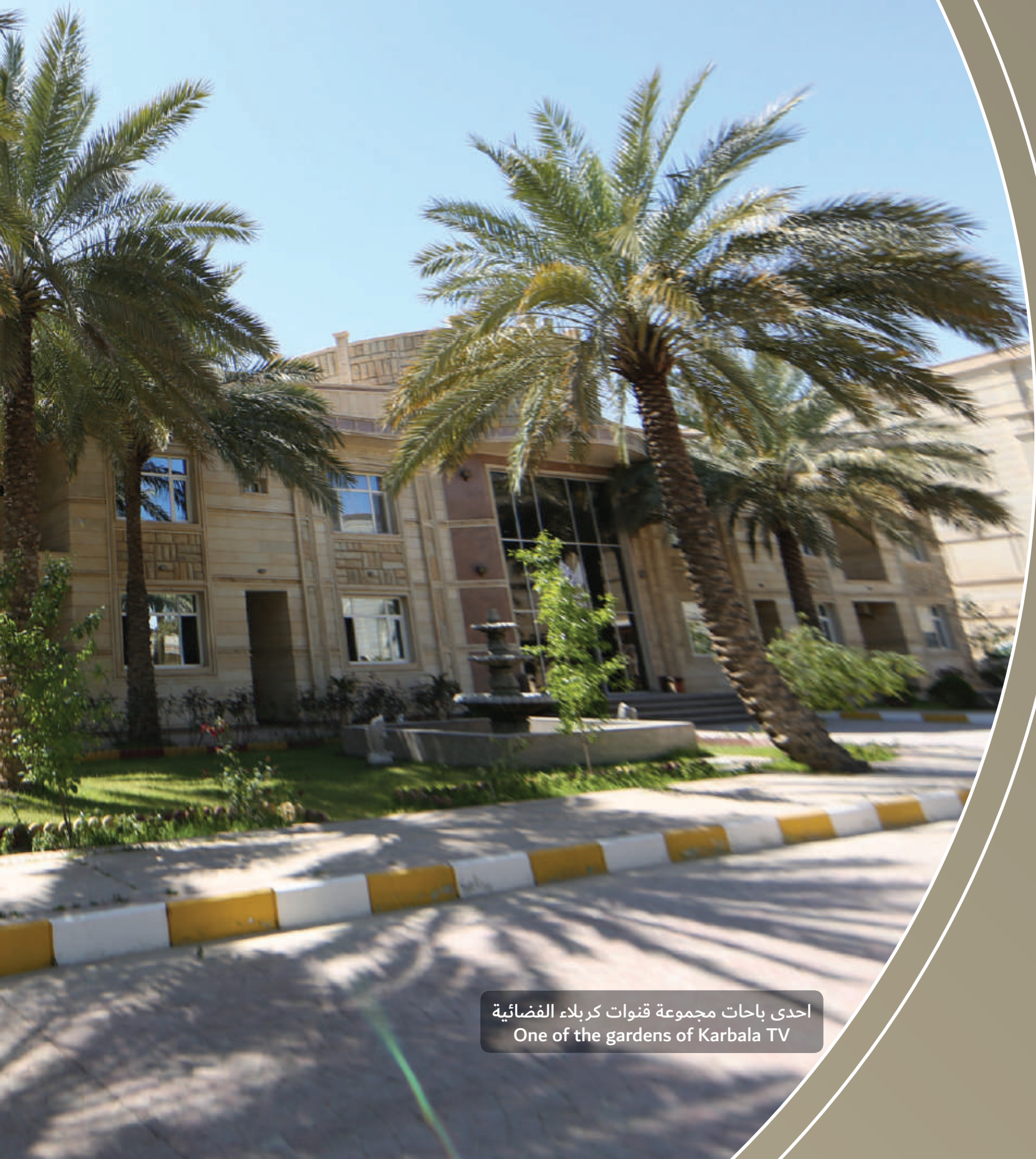
احدى باحات مجموعة قنوات كربلاء الفضائية One of the gardens of Karbala TV